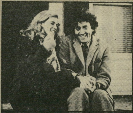
קלי מקגילס וטום קונטי: הזרוק והבריאה

אולם הסרט הוא בראש וראשונה כלי-שרת בידי השחקן טום קונטי, המגלם את התפקיד הראשי בצורה מזהירה. זהו סרט דברני מאוד, כתוב היטב (תסריט: גוליוס אפשטיין הוותיק), וקונטי מנצל כל שורה וכל מסיק כדי להפגין את כישרון-המישחק המדהים שלו. לכל אורך הסרט הוא נראה מקומט, מרופט, מבושם ומבוהל מן המציאות, מחפש מיפלט בתוך כסות משיקה ונתלה לרגע באשלייה של אהבת-נעורים. לידו, אמריקה מצוחצחת יעילה, בריאה בגופה עד להגיעל אמריקה שיש לה מושגים בוריים ומדויקים על כל דבר שבעולם ואינה יכולה להבין שאדם אינו יכול להיכנס למסיגרות קשוחות ונקשות כליכך. וזה הרי בדיוק הקסם של המשורר הזרוק הזה, בעיני הגברות המשועממות מן הפרו-בינעה.