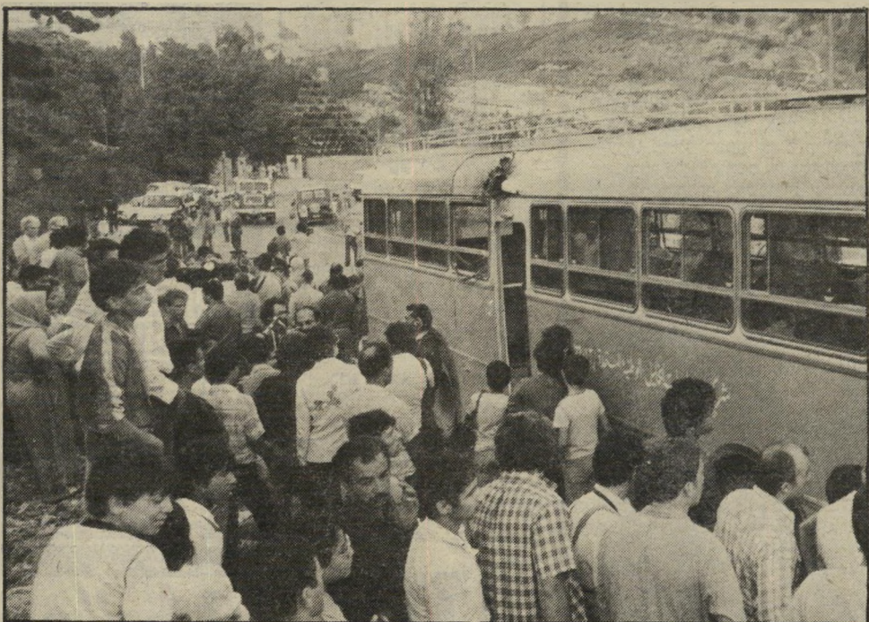
האוטובוס הפגוע ליד בריכת-הסולטאן נקמה על רצח הסטודנטים

ג'מאל למד שפה וספרות ערבית במיכללה בחברון. בימים אלה היה בחופשה מן הלימודים, והלך לעי-