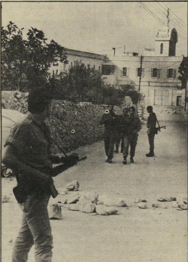
מישמר צה"ל ליד מיתרס-אבנים במיכללת בית לחם. אז תעשו כאילו!

ל ה דרכים המובילות לאוני-ברסיטת בית-לחם נחסמו. חיילים ושוטרי מישמרה-גבול עמדו בכל פינה, כשהם מחזיקים בנשק הם וברובים לירי גאז מרמעי. ליד הכניסה הראשית לבניין המיכללה היו שני מחסומי אבנים גדולות. הכביש כולו היה זרוע אבנים שהשליכו הסטודנטים מתוך הבניין. גלג פלסטיני, בציבעי ירוק אדום-שחור-יזל, התנופף מעל שער-הברזל הסגור. מכשירי-הקשר בג'יפים הצבאיים טיטרו ללא הרף. מפקדים בדרגות שונות התרוצצו אנה ואנה. חיילים רצו מצד לצד, כשהם מקבלים פקודות שונות. בבוקר ירו החיילים גאז מרמעי