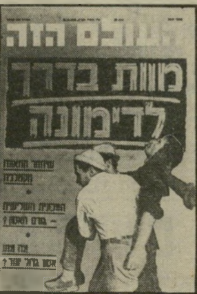
"העולם הזה" 1152 תאריך: 28.10.1959

בחיי שזה נכון מה שאמ'שלי אומרת שאם הצרות באות אז זה בצרות. את שמת לב איזו שנה בלי מזל זו היתה? אני נורא שמחה שהיא עברה, אבל הם מיטכנים, שם בהוליווד, יש להם עוד כמה חודשים עד שזה ייגמר שם. ראית כבר שנה כזאת? קודם מבת טירון פאווה, ואחר-כך פאול רוגלסא אבל הוא לא כל-כך נורא השזן, ואחר-כך מארי לנצה, קיי קנרל, ועכשיו ג'ורג' פלוי, בחיי שהיה לי חבל נורא כשקראתי את זה בעולם הקולנוע ושבועון-קולנוע שנסגר בשנת 1970. בדיוק באמצע שהתחיל עם הבכרלי אירלנד הוותי אוי באמת אל תגידי שאת לא יודעת אפשר להתפוצץ ממך אני לא יודעת באמת למה אני מדברת אתך. היא היתה החתיכה שלו והיא היתה בת 16 והוא בן 50. ככה זה מודרני עכשיו כי כתבו ספר כזה ששמו לוליטה ויש בו ש מבוגר אחד שזוהב ולדות יש כבר לא מתביישים. מה יש, יש באמת בנות בגיל הזה שיש להן כל הגוף והנשמה של אשה, הנה תראי אותי.