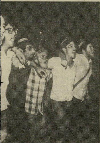
קהל הקפות בחברון לא ספרדים, לא ערבים

אחרי שהגיעו כל סיפרי-התורה האשכנזים, קרא הכרוז לכל המוכרים לגשת לבימה ולקחת ספרים. זה בצד זה עמדו על הבימה השר אריאל שרון, חבר-הכנסת מאיר כהנא, ח"כ הרב אליעזר ולדמן, הרב משה לווינגר. כולם אשכנזים. הם נשאו תפילות, חזרו אחרי הכרוז ואחרי-כך יצאו להקפות סביב הכיכר. "ושכל הגברים ירקרו