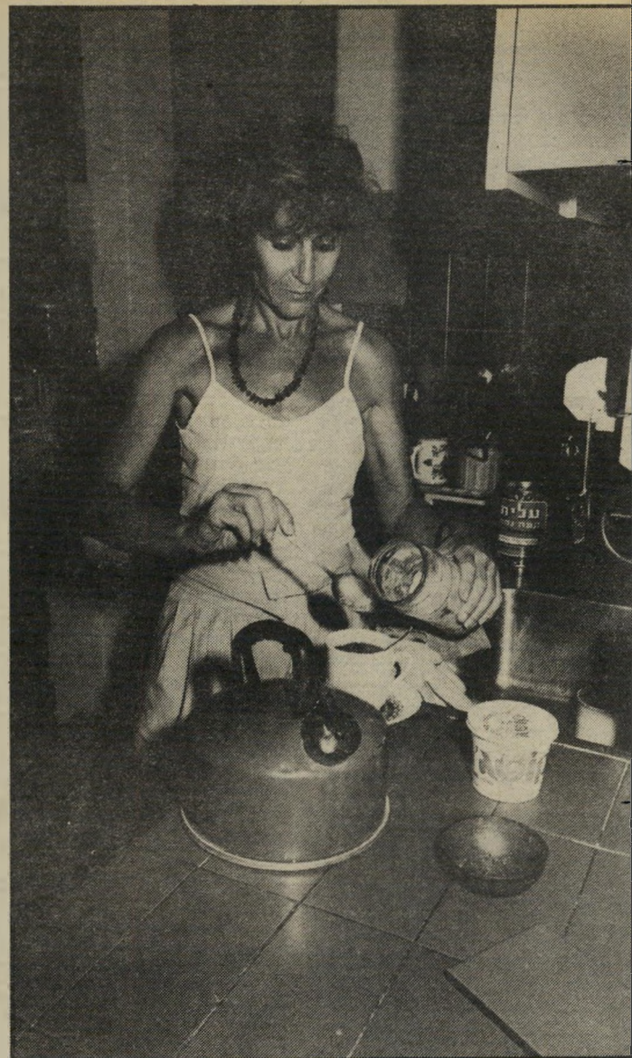
קפה לכל איש עקרת-בית היא לא משתגעת להיות, אבל ארוחה חמה יש כל יום לילדים ולבעל. כי גם מיטפחה של שחקנית צריכה לאכול: קפה אני דווקא אוהבת לעשות.