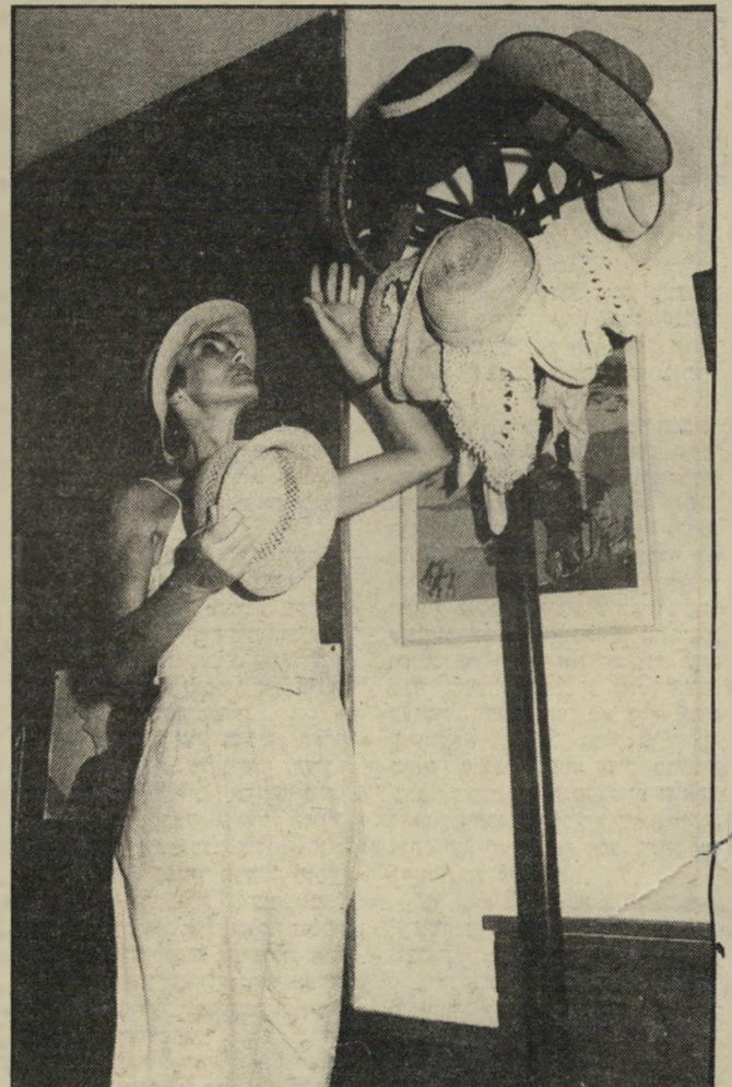
כובע לכל עת כמה פנים יכולה להחליף שחקנית! הרבה יותר קל להחליף כובעים. על עמוד-עץ בכניסה תלויים עשרה כובעים. כל אחד מהם נועד למצב-רוח אחר.