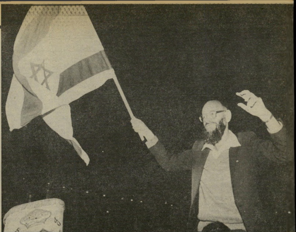
גדול, אחד מרבים שחולקו באותו הלילה לקהל הרחב ונישאו אל-על. לוינגר נישא על הכתפיים שעה ארו- כה, כשמסביבו נערכות ההקפות עם סיפרי-התורה.