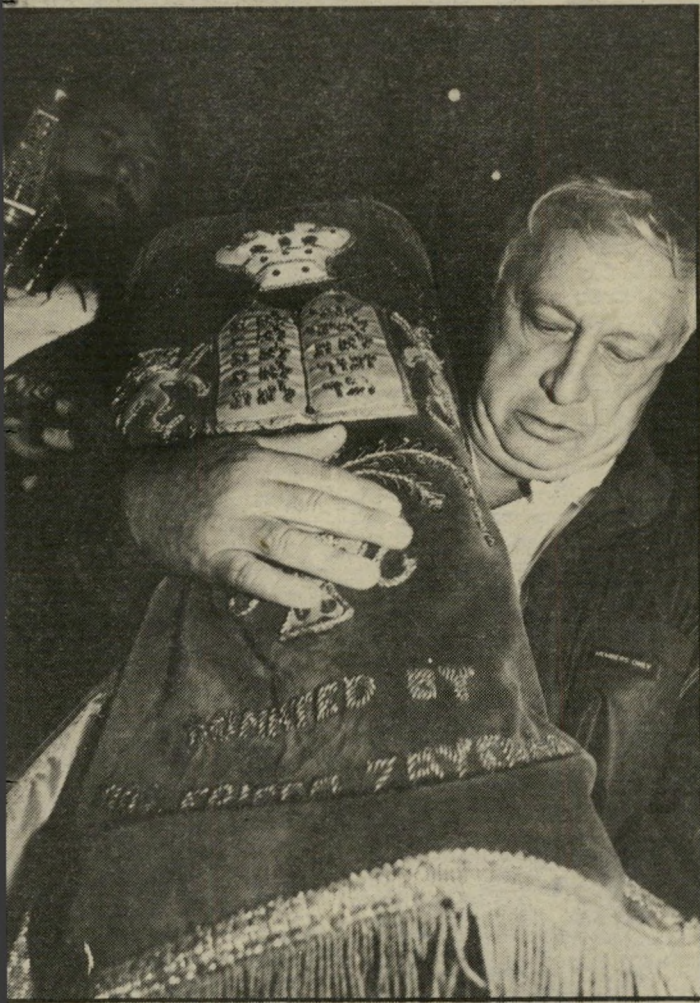
אריק מלך הימין שרון היה השר היחיד שבא לחגוג עם אוהדי אירגון הטרור. הוא נאם וזכה במחיאות-כפיים סוערות. אחר-כך התכבד בנשיאת ספר-תורה.

שכחו את הרצח במיכללה האיסלאמית בעיר, זמן קצר אחר-כך. באותו הלילה שבו התיר שר- הביטחון למתנחלים לערוך את ההק- פות השניות של שימחת תורה בחברון.