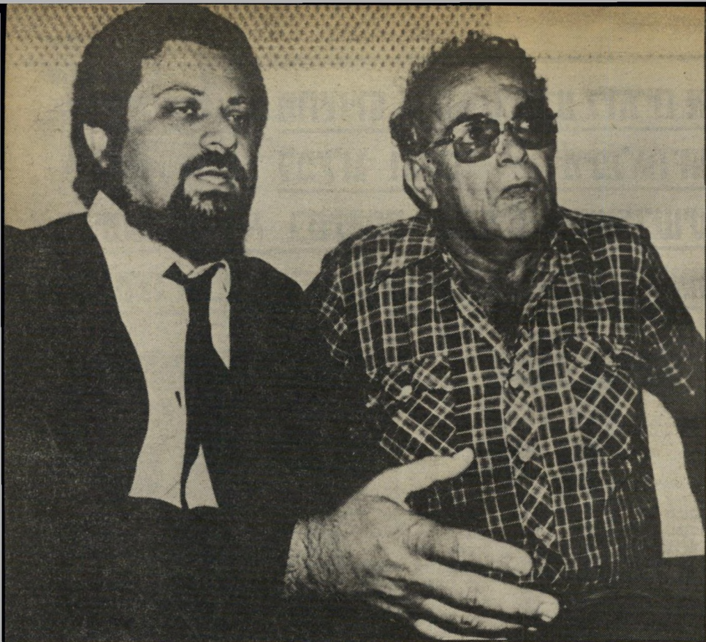
נאשם בירנברג ופרקליטו לשעבר אורן כבר זוכה שלוש פעמים מהאשמות דומות

מאו לא ביצעו אנשיו של זיגל שום צעד נוסף בעניין. צמרת המישטרה לא