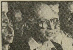
בגין החזרת צויד

"איך הוא נראה, איך הוא נראה?" זו היתה שאלת השבוע שעבר במיסערה הירושלמית שמש. שבה סוערים בקביעות אנשי ציבור ותיקשות. הוא, הכוונה למנחם בגין, שהתייצב לפני העולם אחרי תקופת כידוד ארוכה ומיסגרות, בענייני