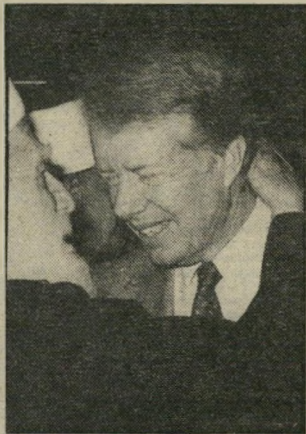
נשיא לשעבר קרטור אחד משלושה

נחוג ♦ יוס'הולדתו ה-60 של גי'מי קרטור , מי שהיה הנשיא ה-39 של ארצות הברית ואחד משלושת הנשיאים לשעבר של ארצות הברית