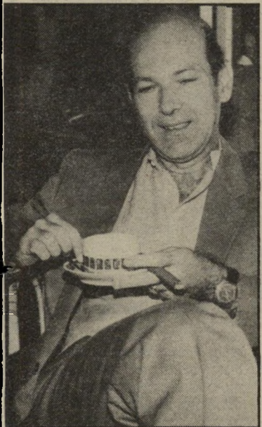
באריסטר פרד 5000 שטרלינג לתיק

הבריטית; את אחד הבנקים הגדולים ועוד לקוחות גדולים ושמינים, כהנה וכהנה. עתה מסתכם שכרו בסכום של ארבע-חמש ספרות לתיק אחד. לרוגי מה: במישפט אורחי, של הפרת-חווה, הנמשך יומיים-שלושה, מקבל באריסטר פרד 5.000 לירות שטרלינג.