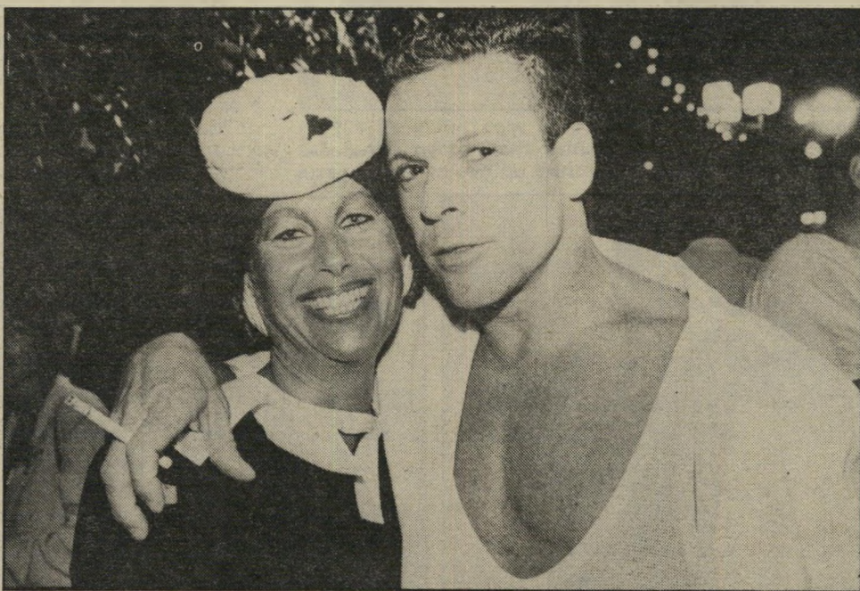
חשוב לי שהבגד יראה כמו שהוא צריך להיראות, עם אביזרים המתאימים לו. היא אומרת, קולקציות חורף מרי עיצובה תוצג בשנה הבאה בבוטיק במינכן.

היא מושכת תשומת-לב. היא לא יפהפיית-הדרור, גם לא גבוהת-קומה במיוחד. הקלוריות לא מדאיגות אותה, מסתבר. רק באחרונה הורידה, ללא מאמץ, חמישה קילוגרם. סתם, בלי סיבה, נסתם לה קצת התיאבון. גם לפני שהורידה במישקל הרי גישה בסדר עם גופה, לא חשבה שהיא שונה מדי. טוענת שהיא לא נכנסת לפאניקה כאשר היא עולה במישקל. כי יודעת שתוכל לרדת בלי בעיות. היום היא שוקלת, היא מצהירה, בדיוק כמו בגיל 18 — 46 קילו. היא נעימת-שיחה, מדברת בקול רך, שקט. מגלה עניין במי שהיא מרבת