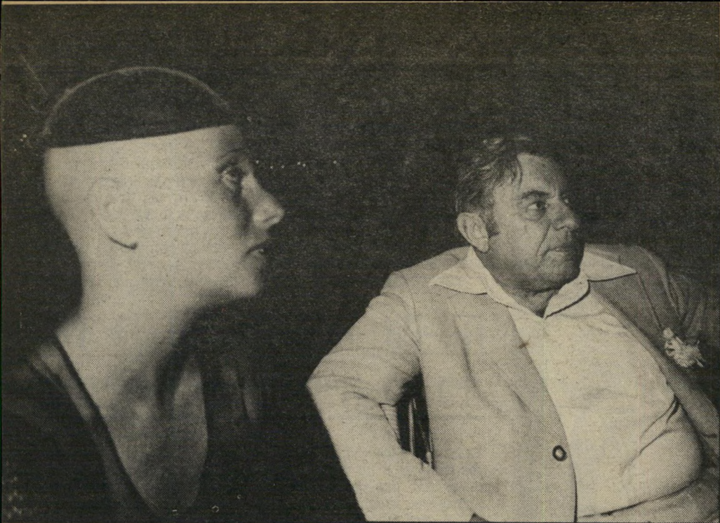
כאשר ביקשה מבנה דנור, להצטלם עימה עבור הכי תבה, הוא סירב בתוקף. בטענה שזוה לא בראש שלי עכשיו. אבל חבריו לכיתה מתפעלים מאמו מאוד.