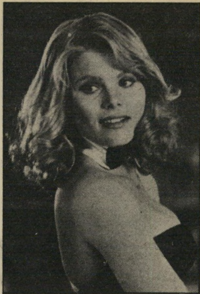
מאריאל האמינגווי לעשות מעל ומעבר