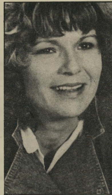
ג'ולי זולטרים ליכלוכית חדשה

אולם נראה שארבעת הכישלונות הגדולים שייכים לארבעה בימאים מפורסמים רווקא, לואי מאל, שעורך התפעלות בהעותו לחרוג מן