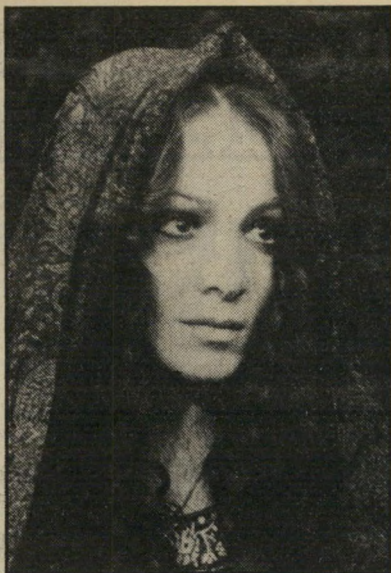
תרזה סטראטאס לדעת לשיר ולשחק