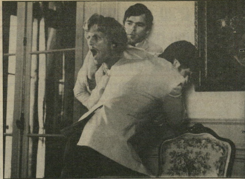
3. קאטר ובון - ארצות-הברית