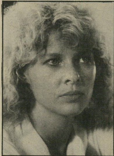
שחקנית מישנה השנה

לצד אוזו הוצגו בבתי-הקולנוע שלושה סרטים יפאניים חדשים, כולם מרשימים. ראשית, חג שמח מר לורנס של נגיסה אושימה, הסרט שהיווה את הפגנת המישחק המזהירה ביותר של השנה. קשה לזכור מתי נראו זו לצד זו הופעות שונות כלי-כך ומרתקות כלי-כך, כמו אלו של דייוויד באווי כקצין בריטי עקשן עד גבול ההתאבדות, ריוצ'י סאקאמוטו, כמקבילו היפאני, טום קונטי, כאירופי המנסה נואשות להבין לרוח המיזרח וטאקשי, בדרן יפאני שגילם תפקיד של סמל שניתן בלבביות החמה ביותר ובסאדריים