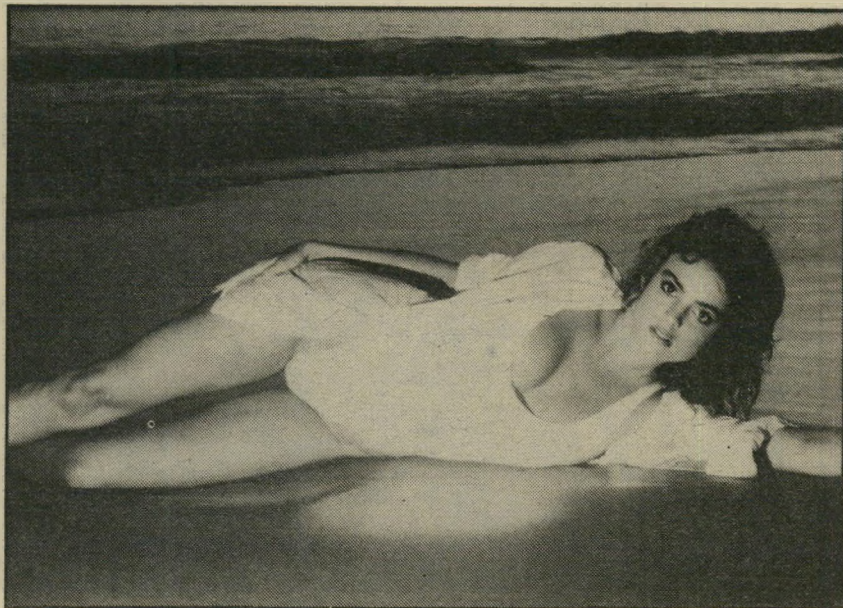
4. בגידות בריו - ארצות-הברית