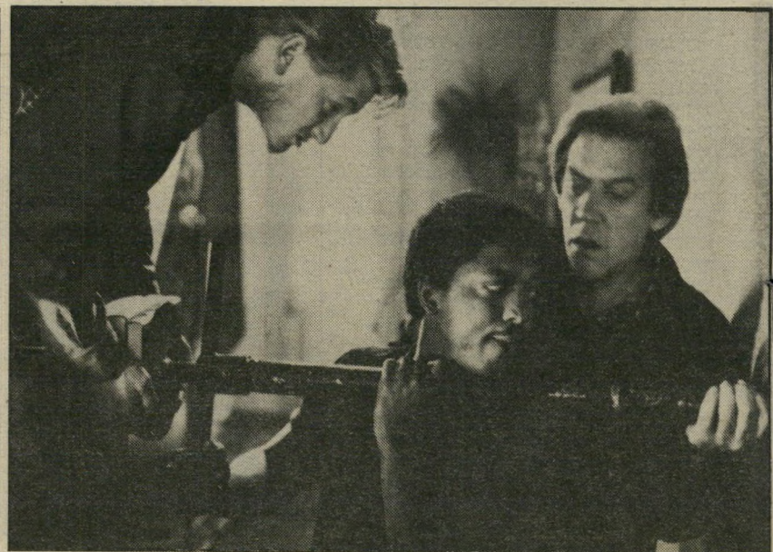
3. מפצחים - ארצות-הברית