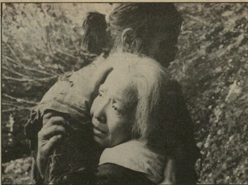
1. נאראיאמה - יפאן