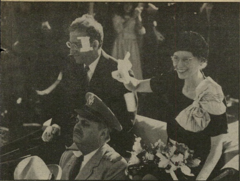
2. זליג - ארצות-הברית