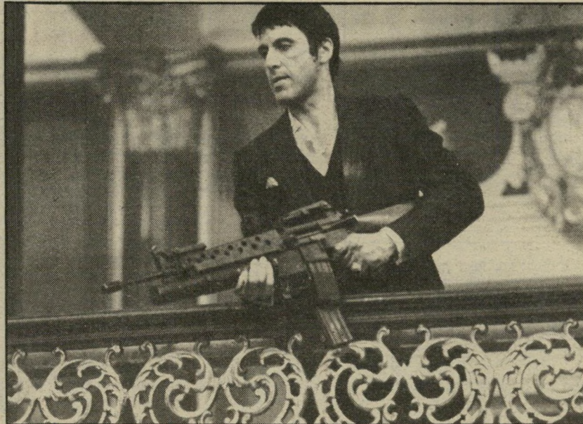
1. פני צלקת - ארצות-הברית