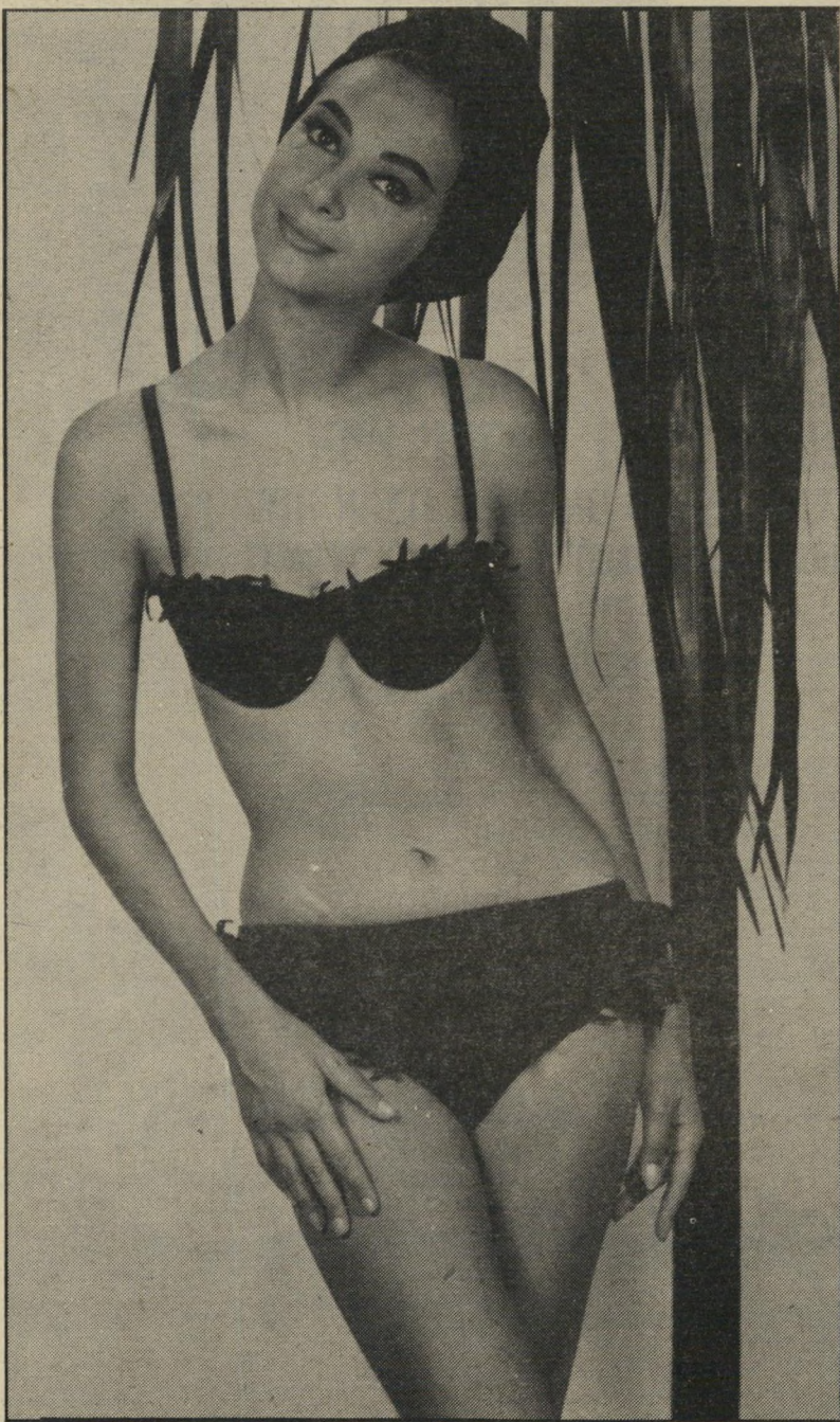
זיוה שומרת. ביקשתי ממנו לעזוב!