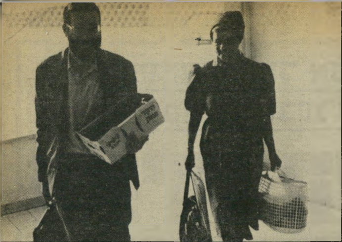
קרובי נאשמים מביאים אוכל לבית המישפט ארוחה באולם הסמוך