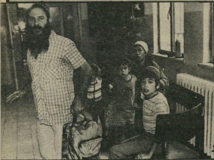
נאשם בךשושן מבלה עם מישפחתו במיסדרון השוטרים שומרים מכני עיתונאים