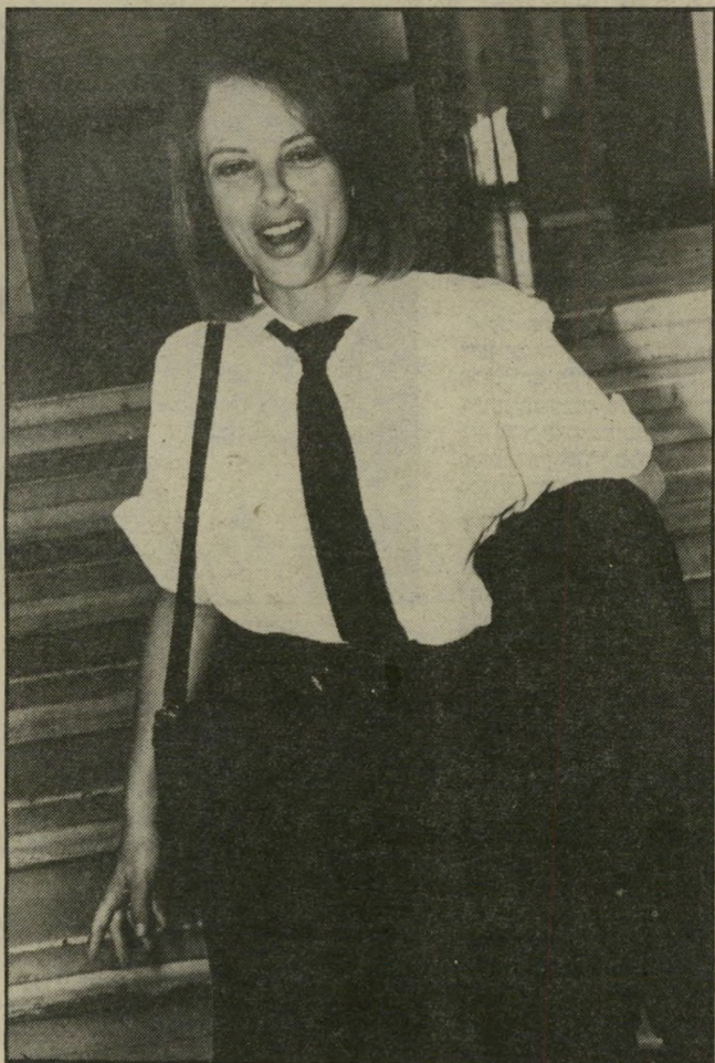
תובעת ביניש עמודישיש וריצפה אמנותית

המישפט הנוכחי כרי לנסות את כל האפשרויות לפסילת הודאותיהם. הנאשמים מסרו לחוקריהם הודאות העשויות מיקשה אחת. הם לא הפרידו בין עניין המיכללה האיסלאמית לבין יתר העכירות שבהן היו מעורבים. ובכך הסתכנו בעונש של מאסר-עולם. לכן אפילו אם רצו להודות ולסיים בעיסקת טיעון את יתר הפרשיות, הקלות יותר, אין ביכולתם לעשות זאת, מבלי לפגוע בסיכוייהם במישפט-הרצח. העומד להתקיים אחרי תום המישפט הנוכחי. אם יסכימו הנאשמים וסנגוריהם במישפט הנוכחי, כי הודאותיהם ניתנו מרצון חופשי, לא יוכלו לבוא במישפט הרצח ולטעון דברים אחרים. וכמוכן שרצוי להם כי כל הנאשמים ייצרו חזית אחידה ויטענו כי כולם רומז, פתו ואלצו למסור את ההודאות.