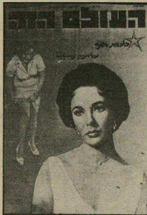
העולם הזה 1150 תאריך: 14.10.1959