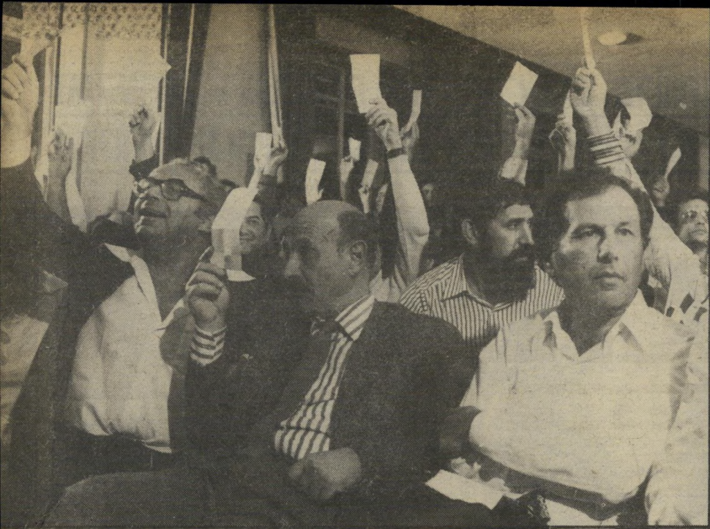
בחזיון: רובינשטיין אינו מצביע בעד הצטרפות ר"ש למומשלה (1977)* למה לא?