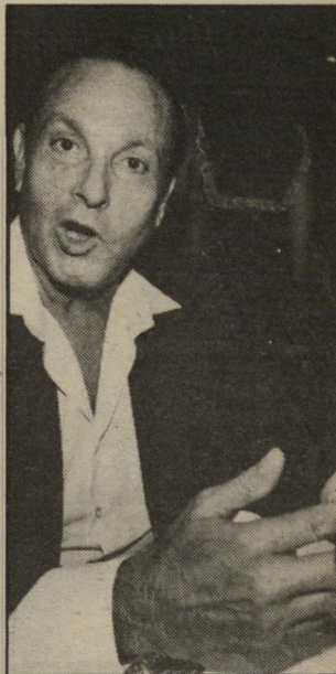
מורעי מצעירותו! מה זה?

אחד מחברי הכנסת סיפר לי שכעת שטעי צהריים בחלקו הסגור (רק לחברי הכנסת) של מיוני הכנסת, היה עד למנוולוג שהשמיע שר ליברלי בממשלה באוזני אחד מן חברי הכנסת של מפלגתו. נושא המנוולוג היה יושב ראש הכנסת לשעבר (גם הוא ליברלי).