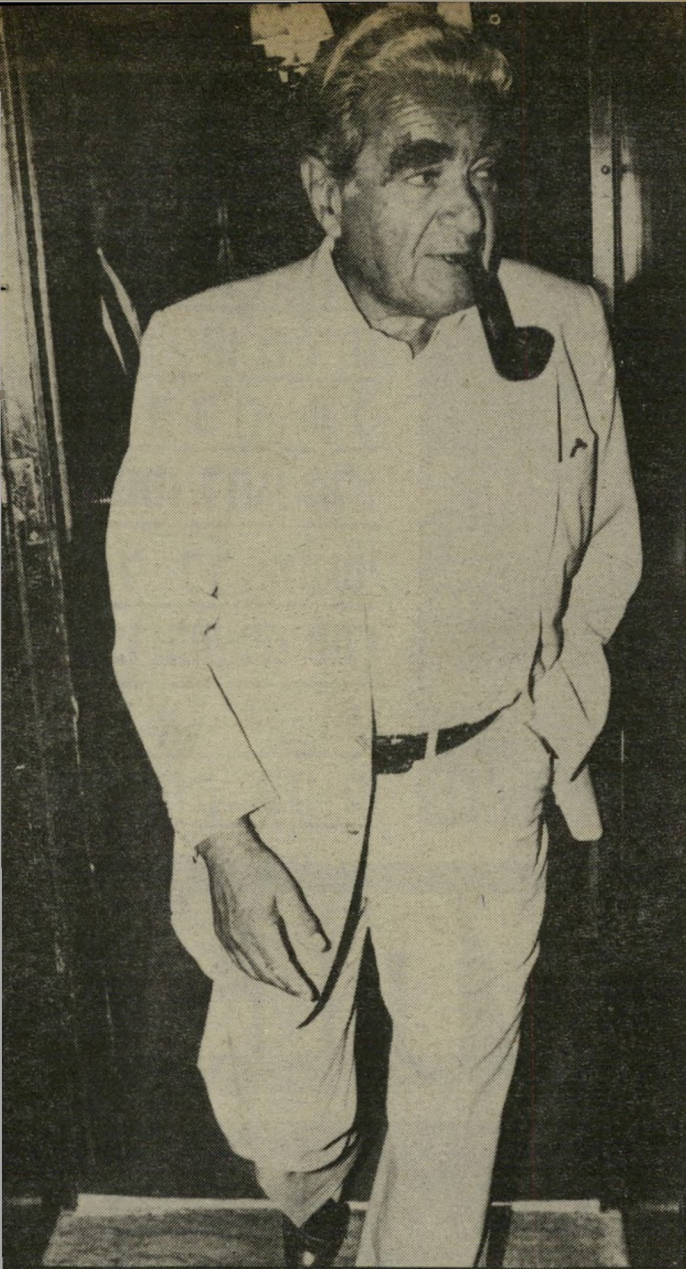
דולצין בא ידועות ידועות