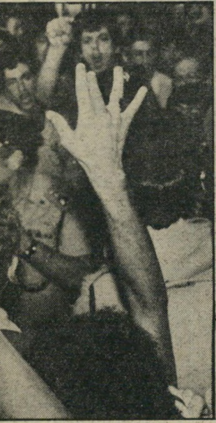
תנועה אנשי כהנא מניפים ידיים ואצבעות ב"תנועה מגונה לעבר מחנה השמאל."

לעוברים ושבים חומר תעמולה ואחר-כך אף השליכו אותו על המידרכה. הם, כמוכן, לא נעצרו בחשד לזיהום מקום ציבורי. כשאתר מאנשי כהנא הרים את ידיו הוא נעצר, לא לפני שבני ברכש נלקח אף הוא מהמקום. לקראת השעה 8 החליטו השוטרים להפסיק את העימות המילולי בין שתי הקבוצות, משום שחלק מהמפגינים החלו יורדים לכביש וחוסמים את התנועה. אבל כהנא לא הסכים לעזוב לפני ששנא נאום קצרצר בפני אנשיו.