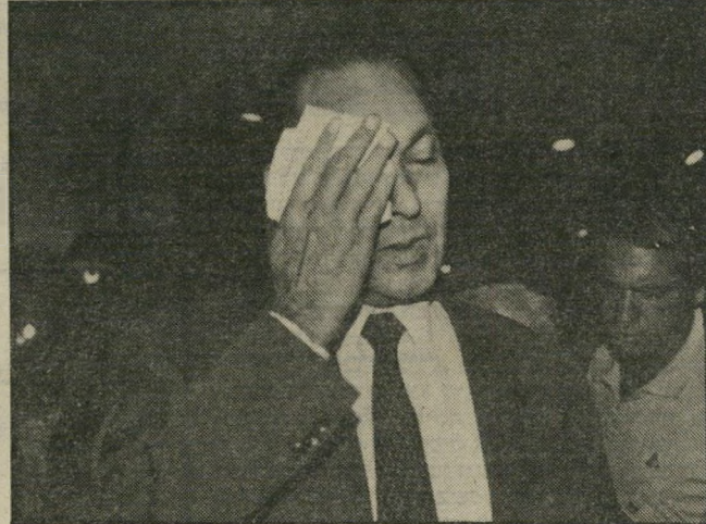
בכנס בינלאומי אינפלציה מיפלצית

ואין זה משנה אם הסיבה היא שמונעים ממודעי לפעול, או שהוא לא יודע מה הוא רוצה. מודעי כהרגלו הגיב בועם. הוא כבר