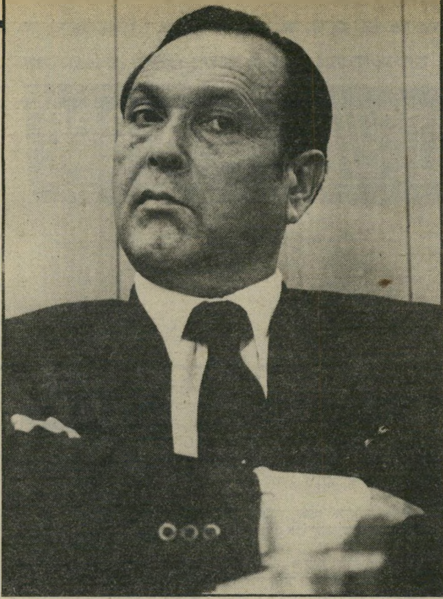
במיישרד האוצר בלון נפוח

הודיע שהוא ישוב את הכלים וייצא מהפוליטיקה. הוא זועם על האגף הפופוליסטי בתנועת החרות, שבראשו עומדים לוי ומשה קצב ומוצא לו נביזרית נאמן, פרס. זה מפקיר למעשה את מוכ"ל ההסדרות ומותיר את המיגרש של ישראל קיסר פנוי לפעולות יזומות של סיעת תכלתי לבן. אנשי חרות בהסדרות, יש הגורסים שמודעי מודע לכך שאין לו תוכנית, ואף לא הצעת מיסגרת לתוכנית כלכלית, ושהוא ינצל את התודו ובוהו שמשתרר עתה במשק, לחיסול-חשבונות פנימי בתוך הליכוד. לפני הבחירות התעלל לוי