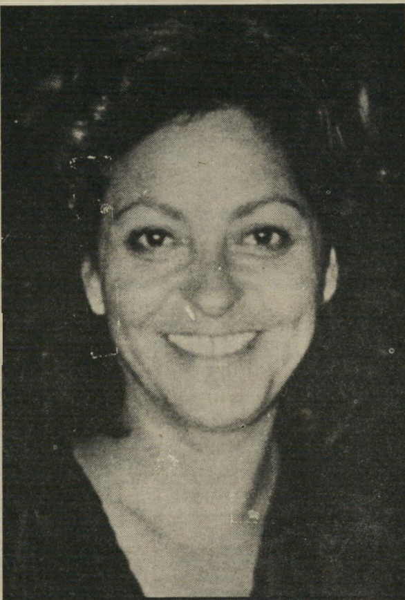
ברוריה ציוון לזרוק חפצים

על חטא שחטאנו — טרח מכה, על זרון — שתיים. על עוון שלוש. על שעיוונו — ארבע, וכן הלאה, וכן הלאה, ואת כל אלה אומרים צדיקים גמורים בהגיע הימים הנוראים, ומייסרים את עצמם חוזר ושוב. לעומתם, אנוכי מעשית יותר, תחת להכות על כל החטאים, וכולכם