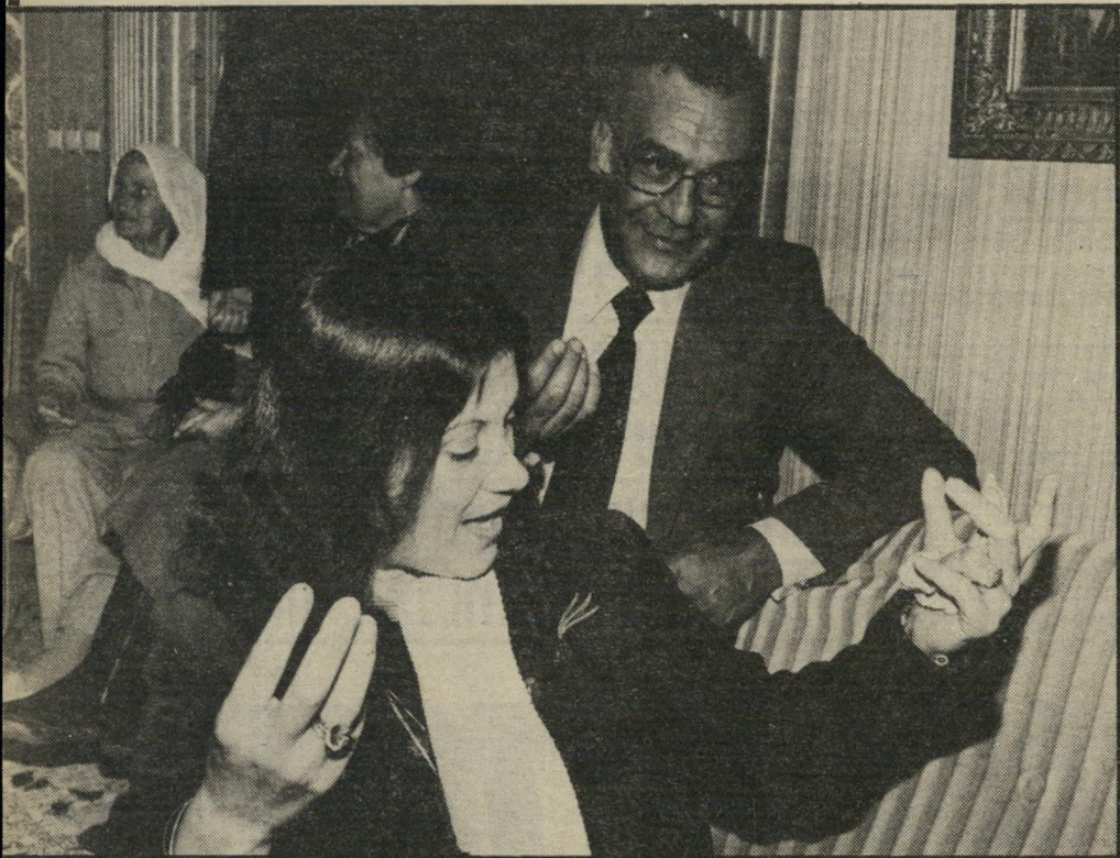
האג'יחיא ואשתו סוהיל בחגיגה מישפחתית דווקא בגין רצה

נושא מינויו של שופט ערבי לבית-המישפט העליון עלה וירד מעל כותרות העיתונים מפעם לפעם בעשר השנים האחרונות. הנימוק לצורך כשופט ערבי היה ברור לכל. בין 12 השופטים העליונים צריך גם אחד שייצג את האוכלוסיה הערבית, המהווה 17% מאורחי המדינה. אולם נגר נימוק זה הועלו כמה וכמה נימוקים. הנימוק הראשון, אשר הצביעות זעקה ממנו, היה הנימוק שאין למנות לבית-המישפט העליון שופט, אלא על פי כישוריו המיקצועיים אישיים בלבד, ואין למנות אדם לתפקיד רם זה על סמך שיקולים זרים. אולם כאשר, מזה שנים רבות, נשמר בבית-המישפט