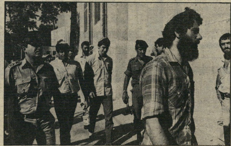
נעצרי המחתרת בדרך למישפט: המטרה - להרוג ערבים

כבר מראשיתו עורר מישפט זה בעיות צדדיות. הנאשמים הוכנסו לבית-מעצר מיוחד והיו טענות כי התנאים במקום מעצרים טובים בהרבה מאלה של עצירים רגילים. לעומת זאת,