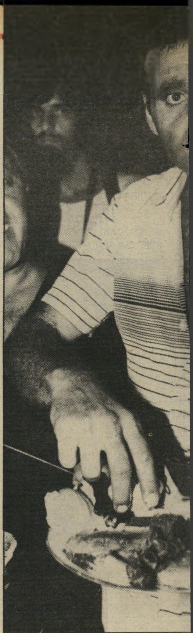
זמר ארוכות, פעם ברמלה ומעם במעשיהו. ר. אמיתי שלפי גירסתו גם נכתב סרט על ידיד אישי של הבימאי. ועזר לו רבות גם לעיניו בסרט כשחקן ובהכנת הדמויות.