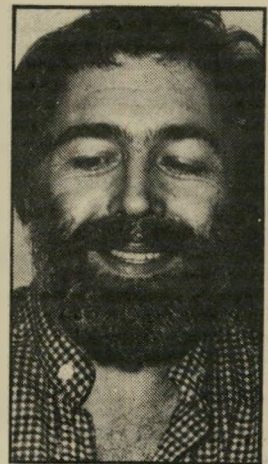
מחזאי סובול הדייסה של בגין