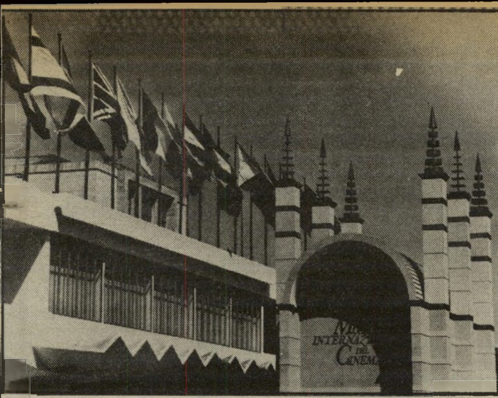
דגל ישראל הונף לראשונה מזה שנים רבות בחזית ארמון הפסטיבלים של ונציה. הפסטיבל שבעבר הלא רחוק החרים את ישראל קיבל את מאחרי הסורגים בהתלהבות רבה.