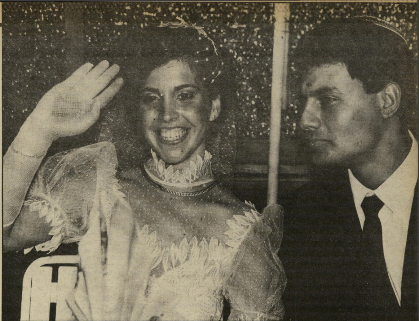
לאורחים. בעלה הטרי (22) לבוש בחליפה כהה ובחולצה לבנה ועניבה. חבוש כיפה סרוגה לראשו. השניים ישבו במשך רוב הערב ליד שולחן הכבוד, בין הנשיא הנוכחי, חיים הרצוג, ובין הנשיא הקודם, יצחק נבון.

השולחנות היו ערוכים כמו בכל חתונה אחרת, של כל מישפחה אחרת. קרובי-מישפחה הובילו את האורחים למקומותיהם. במרכז האולם, מול הבימה, עמד שולחן גדול ועגול ומעליו