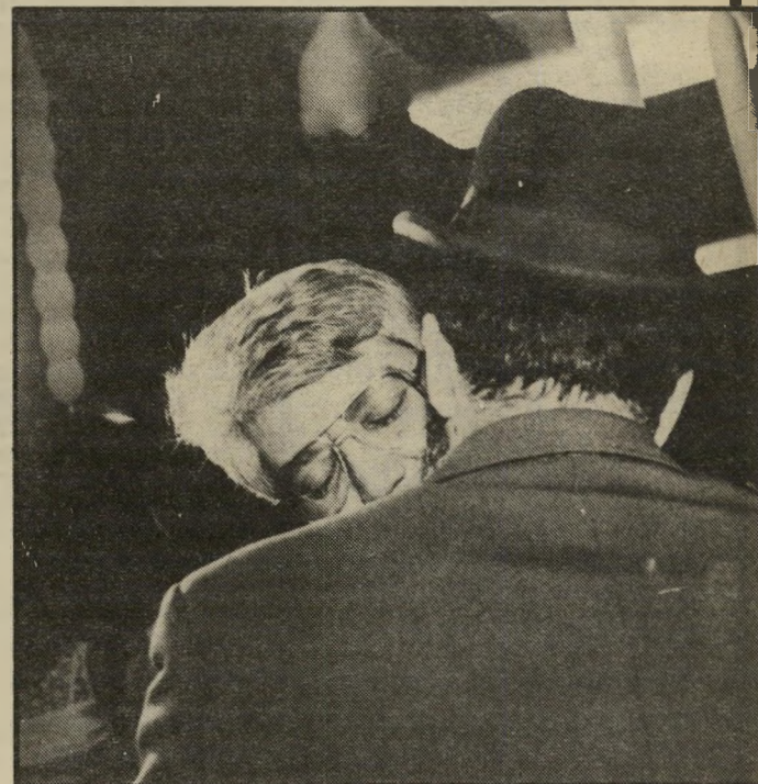
נשיקה דויד לוי, האב המאושר, מתנשק עם יצחק פרץ, ראש סיעת ש"ס. פרץ היווה אטרקציה במקום, הוא עבר משולחן לשולחן, הסתודד עם הנוכחים באירוע, התנשק עם כולם ושפע חיובים.