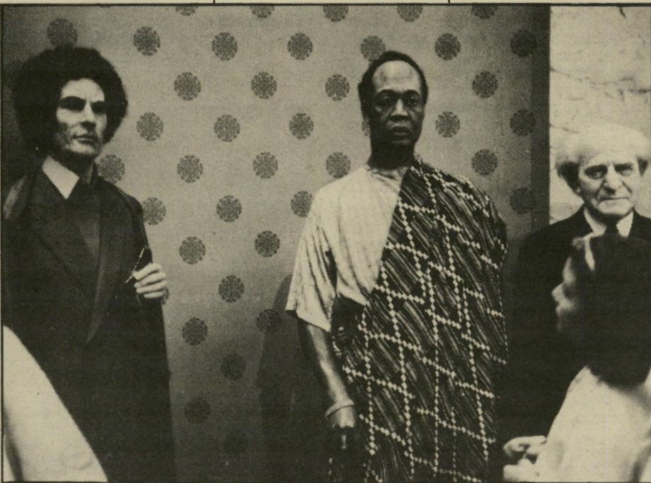
דויד בן גוריון ראש-הממשלה הראשון של ישראל, הועבר לאגף אחר במוסיאון השעווה מאדאם טוסו' בלונדון. הוא הוצב ליד המנהיג האפריקני אנקומו אנקומו. נשיא גאנה לשעבר (באמצע). ולא רחוק ממנהיג לוב, מועמר קדאפי, שהשבוע חגג 15 שנה לעלותו לשלטון. בעוד שקדאפי-הבובה דומה מאוד למקור, הרי שבובת דויד בן גוריון ניתנת לזיהוי רק על-פי גובהה.