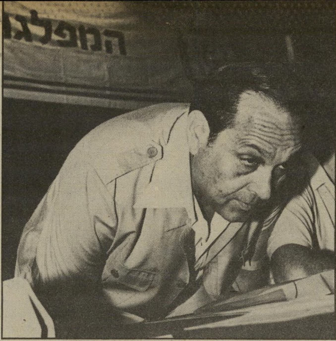
מודעי מפקח המיועד לשר האוצר, שנבחר מה־אחד לתפקיד המוצע, בוחן מקרוב את פני הנוכחים לפני שניגשו להצבעה על בחירת שלושת השרים האחרים של הליברלים.

המרכז הזה כבר ידע רגעים מסוערים יותר. התוצאות, כצפוי, לא הפתיעו. הן הוכיחו פעם נוספת, שאין להאמין לאף חבר מרכז אחר, המכריו מראש למען מי הוא יצביע. שלמה להט הסכים לגלות שלא תמך בניסים, באותה הפתיחות שבה הוא תיאר את המעלות המפוקפקות של חברי המרכז האחרים. הוא הסביר שהוא לא התמודד כי הוא, בניגוד לאחרים, „לא מוכן להחליף מישרה קבועה בזמנית“.