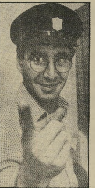
טוב כפקח עירוני כייסת בכותל המערבי

"לפני שעלינו לאוטובוס, קניתי ארטיק ואכלתי אותו כמו טמבל, ככה שהוא נזל וליכלך אותי. הכחורה שהתי יישבתי לידה זזה ממני ועשתה העוויה. אבל הכייסים לא שמו לב אליי, הם ראו כי רק פועל טמבל.