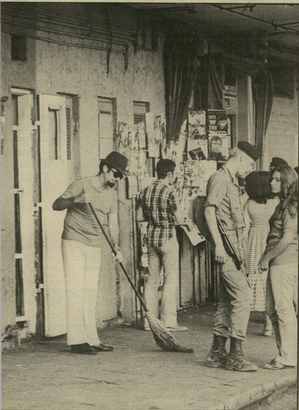
בלש טוב (בעל המטאטא) בפועל בתחנה המרכזית ארנק בבית-שימוש