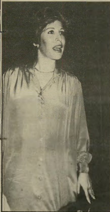
דליה מזור בשביעי

דליה מזור שולטת במסך הטלוויזיה הישראלית זה יותר מעשר שנים. בשנים אלה התרגלנו כולנו לראות אותה כמה פעמים בשבוע. כשהיא חייכנית וזוהרת.