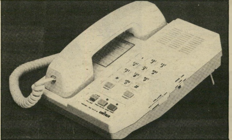
טלפון שני הקווים והמרכיזה לשוחח, לצעוק, ליילל

יכול להיות, לא בטוח, שהעשור הזה של שנות השמונים, ייקרא על שם הטלפון, מה שאפשר לראות באמריקה בענייני טלפונים, הרמיון לא היה מעלה, תחילה גדול נעסוק בשתי המצאות חדשות ואחריהן נעבור לתחום המציאות הטלפונית, המצאה חדשה, רווקא מצרפת, הופכת את פינקסיטלפונים האישי והביתי למיותר.