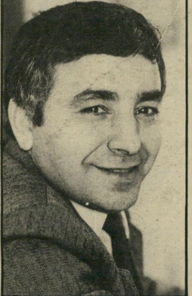
יו"ר-רדיו עמור ספור את המיזרחיים

יפנה מישהו מעיריית-פיתוח, שיהיה מוכשר ויענה על הקריטריונים, בוודאי יתקבל ויזכה ביחס כמו כל אחד אחר". הוועדה המקבלת את העובדים החדשים מחמירה, ציין, והוא אינו מוכן לרדת בקריטריונים. אולי מוכן המפקד להכין רשימה של בני-עדות המיזרה בתחנה? נשאל בני-שישי, "זה עלבון לי ועלבון לבני-עדות המיזרה