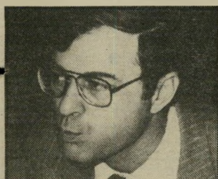
ח"כ לין כמרים וליבראל

רבריו של ח"כ אוריאל לין, המאשים את הערבים בכיצוע מיספר רב של מעשי-רצח, מבלי שיהיה לו כל בסיס וכל הוכחה לטענות אלה, מהווים למעשה הסתה גזענית חמורה, ה"מכירה את עלילות-הדם נגד היהודים.