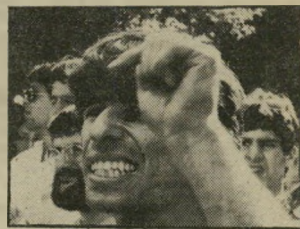
קורא מורד גם המערך גם הליכוד

יש גם במערך, שבו חברתי, וגם בליכוד. דויד מולד, ירושלים