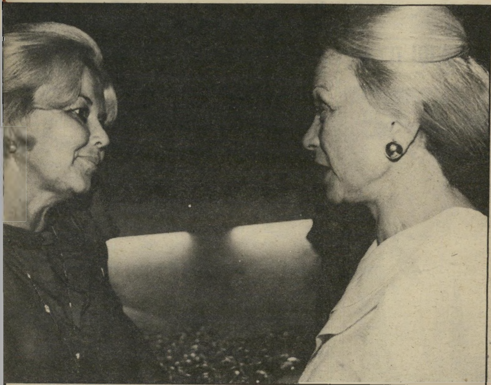
בבית-חולים ביילינסון בפתח-תקווה, שהגיעה הישר מירושלים, מתצוגת שבוע-האופנה. הד"ר חזתה בדגמים החדשים של בגדי-הים לעונה הבאה ורק אחרי זה באה לראות את הצלחות של הפסלת גור.