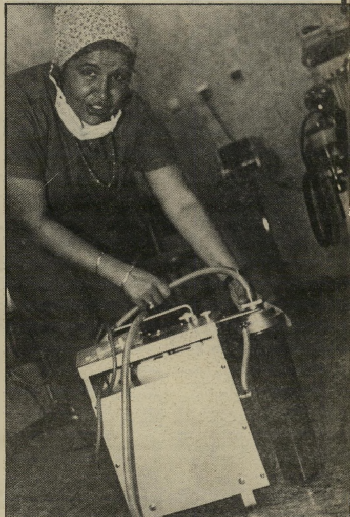
המכונה מרי המצאתו של הרופא האמריקאי, שדאג להביא אותה איתו לארץ. הוא הביא איתו גם חגורות ותחבושות מיוחדות, שבהן הוא חובש את הנשים המנותחות מיידי אחרי הניתוח.