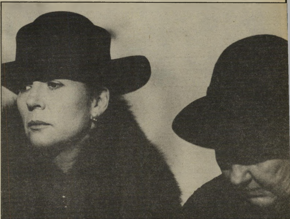
אותה מהונגריה של 1956. בוגוד בחברו הטוב ביותר. הפרס הראשון. ברדלס הזהב ניתן לזר יותר מנג'ערן האמריקאי והשני, ברדלס הכסף, למלך סין הצרפתי.

* סרט אחר יוצא דופן שהוצג בכיכר הוא סרט של הבימאי דניאל שמיידט. הנשיקה של טוסקה על בית ורדי. סרט תעודי על בית אבות שיסד המלחין האיטלקי לזמרי אופרה בדימוס. בניגוד למה שיכול היה להיות פאתטי ומעורר רחמים מתגלים הזמרים הוותיקים כאמנים מלאי שמחה.