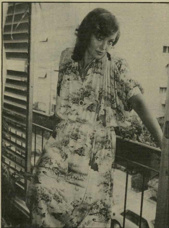
אירים לכתוב שירים ולצייר

חות שהיו לי באו מהמחשבה שאני רוצה להתחתן וללדת ילד נורמאלי שלא תהיה לו אמה נרקומנית. הייתי כלי אהבה. אני, שכל-כך אוהבת לאהוב. זה היה לפני שנתיים. דאגתי להיעלם. כחודש הראשון אחרי שעובתי, עשיתי את העסק הראשון שלי. היום אני בדיאטה. הורדתי כבר עשרה קילו, כי אחרי שהחלמתי הגעתי כבר למישקל של 70 קילו יותר ממה ששקלתי כשנכנסתי לבית-החולים. היום יש לי דירה מסודרת עם חדר מיוחד לציור, כל זה מחוץ לעיר. רק לפני חודש, כשאני בת 28, מצאתי אהבה. זה בחור מקסים וההורים של שנינו מכירים, הוא ספורטאי ישראלי שחי באמריקה. אני מרגישה שאני מאוהבת.