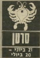
סרטן 21 ביוני - 20 ביולי