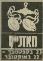
מאזניים 23 בספטמבר - 22 באוקטובר

זה לא הזמן לבילויים חברתיים. דרושה הר" בה אנרגיה כדי למלא את הצמימות של ה" סביבה. מאחר שאתם נוסים לחלות ומצב" הרוח אינו טוב במיוחד, רצוי שתדאגו למלאי של ספרים ותישארזו יותר עם עצמכם. טוב לתכנן כעת את עתיד" כם המיקצועי, אך עדיין לא לדון על כך עם איש. בשלב זה טוב לשמור על סודיות.