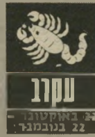
עקרב 23 באוקטובר - 22 בנובמבר