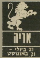
אריה 21 ביולי - 21 באוגוסט