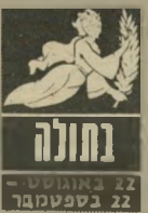
בתולה 22 באוגוסט - 22 בספטמבר

החודש האחרון היה מאוד מעייף ולמרות שחלק מכם בילה בחופשות לא היתה הרגשה שקשור וחתם כראוי. כעת טוב לחזור לשיגרה המוכרת. ולחשוך ב" נסיעות. ברנע זה אתם חשים בחוסר שקט. ובני מיטפחה מסתכסכים אתכם ללא כל סיבה מוצדקת. בתחום ה" רומנטי תוכלו כעת להנות מהצלחות. נשים בנות בתולה חשוב ש" יחדשו את המלחמה ולא יצפו בבית לטל-פונים. עכשיו מאוד חשוב לקחת יוזמה.