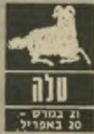
טלה 21 במרץ - 20 באפריל

נסיעות שתוכננו לתקופה זו עלולות להתעכב או להידחות. מיסמכים, תעודות או כל דבר אחר הקשור לנסיעה עלול ללכת לאיבוד.