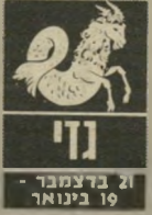
גדי 21 בדצמבר - 19 בינואר

חשוב להשיג היטב על כל בחום ה" רומנטי אתם בחחלט יותר מקובלים. ידידים מחו"ל ישמעו את קולם או יבואו לפתע בהצעות מעניינות. נצלו היטב את ה"23 וה"24 בחודש. כל אי-הבנה שקשורה ל"27 או ל"28 בחודש כדאי לקחת בקלות יותר. מאוחר יותר הכל יראה באור חיובי יותר.