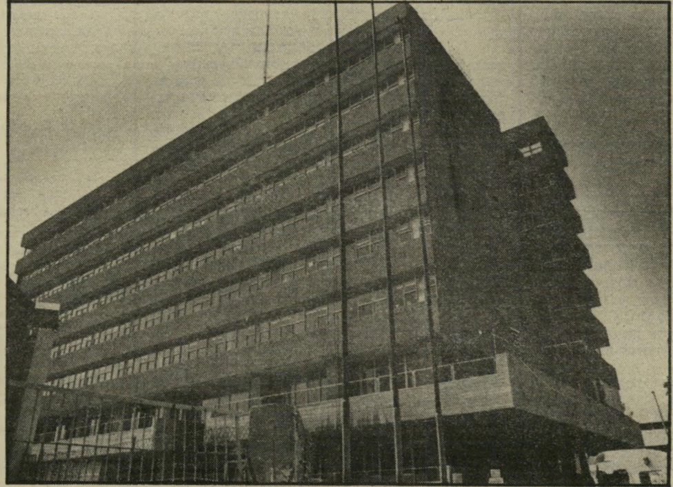
בניין אגד האוויר ימשיך להיות מזוהם

יפה נמודי-הקומה וכבר-השמיעה אינו כלכלן במיקצועו. אך הוא מיטיב לקרוא את מאזני חברות-הבת של אגד מאנשי מיקצוע רבים. יפה, ערמומי ומתוחכם, שיחק חלק מרכזי בפרשיות אגד השונות בשנה האחרונה.