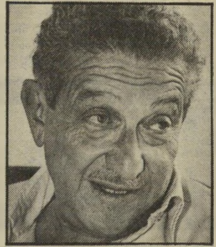
וייצמן חיפושים בלילה

התפנית לא היתה על רקע כלכלי, מרגישים במערך. ביום השבת, בשעה 22.30, צילצל וייצמן