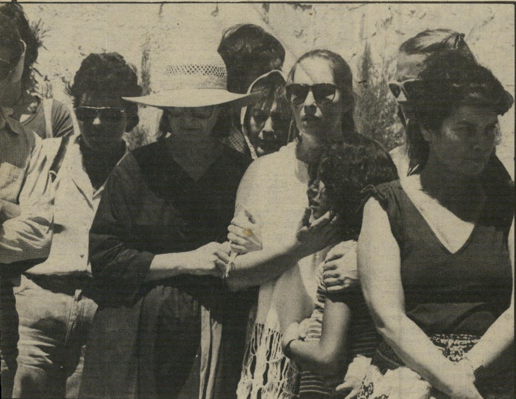
את עתליה, בתו בת ה-10 מנישואיו הקודמים. השתיים עמדו במשך כל הטקס מחויבות וצפו בהורדת הגופה אל הקבר ובחברים הרבים שעזרו.

סיפרו הראשון לילה ארוך יצא לאור בשנת 1963. את הספר הקדיש לבתיה, נערה מבית חרדי, שבה היה מאוהב ושבשהשפעת מישפחתה עזבה אותו. "הקרושה מתה בקץ מלחמות / את נושמת! (כולד!)