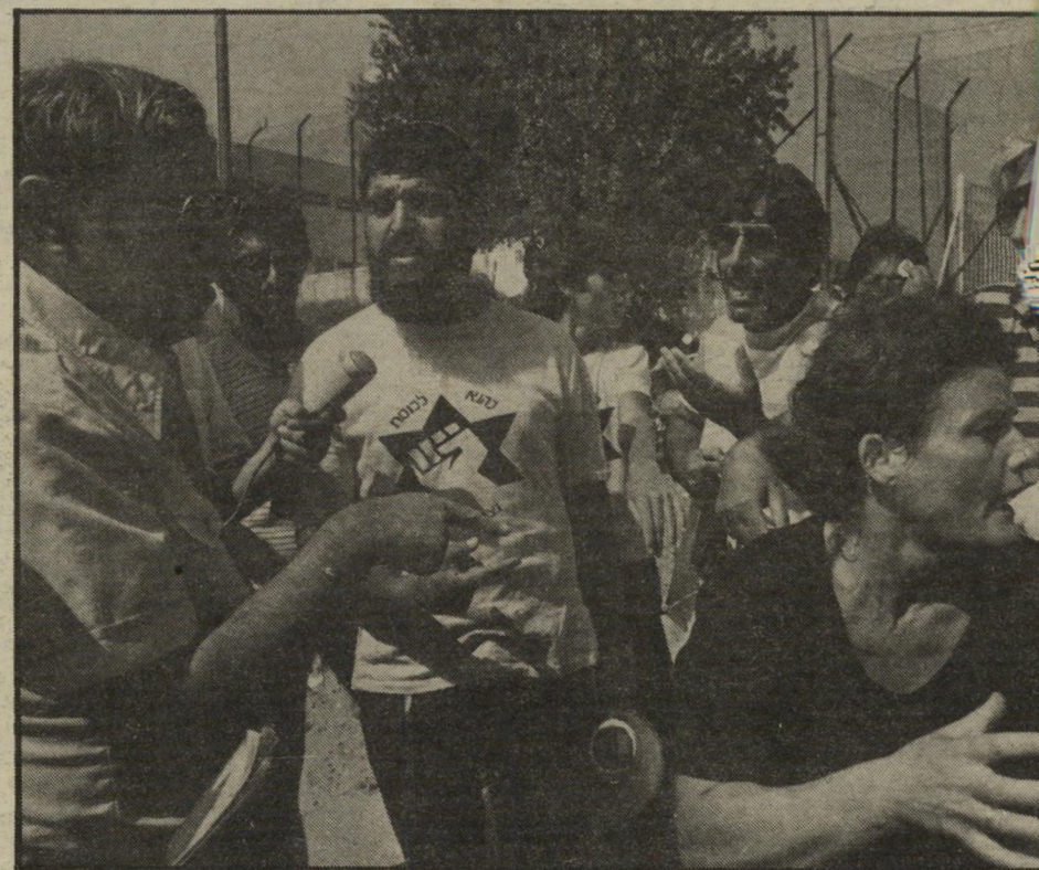
אמו ואביו של החייל תמום ואנשי כהנא מול ח"כ שליטא מה יש להסתיר? מה יש לפברק?

על פי תסריט זה, טיפל בורג גם בעצירי הטרור היהודי המואשמים