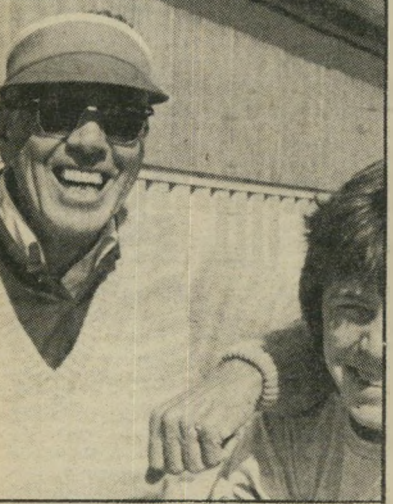
מייסד מלוני 1000 דולר. להתחלה

ועוד כמה מעלות למערכת. נניח שאתה כבר שוכב במיטה. רעיתך, במיקרה זה כבר ישנה, אתה עוד לא, ובא לך לראות סרט טלוויזיה. בא לך, מה אפשר לעשות. אפשר. מכבים את האור, מדליקים את הטלוויזיה, סוגרים את הווליום, ותוקעים איזניה באוזן ימין, או אולי אוזן שמאל, תלוי באיזה צד אתה יושן, באשר אתה יושן, והנה ברברי