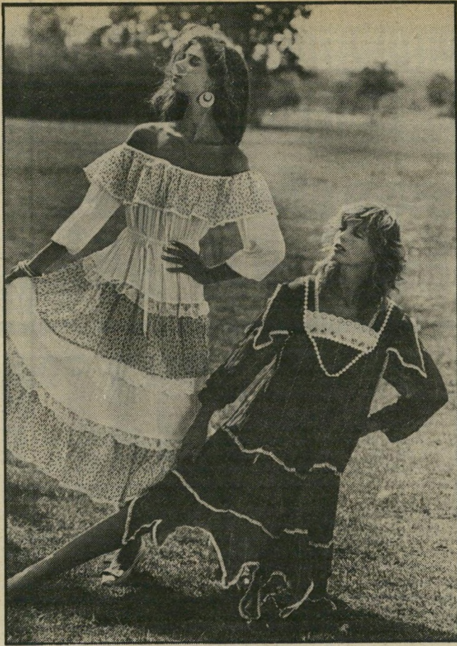
דגמי-סתיו ל"יריד האופנה" שלושה אנשי עסקים

הודעה פומבית. שליטא, חברו של שימעוני, שאחרי-כך נחקר אודות טיב קשריו עם ח"כ ממנחמיה, דרש