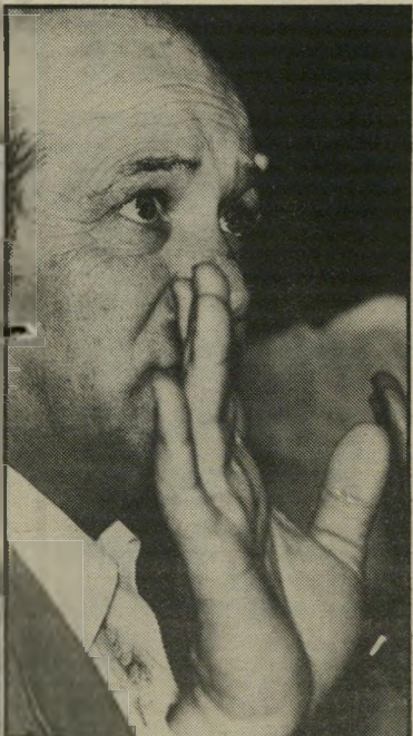
ח"כ חדש מצא אכסידנט פוליטי

לעומתם, באו מארצות שלא היו בהן מהפכות והם התרכזו בהנהגה רוחנית ובכניית מוסדות תורה. כך קורה שהמנהיגים הם אירופיים ומי שהצטרפו אליהם הם אלה שהחוש הלאומי טבוע בתוכם. שני עמים שהופכים לעם אחד."